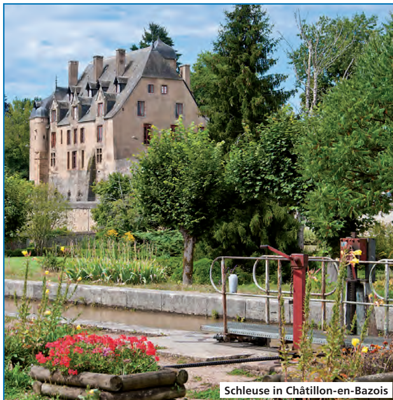
Schleuse in Châtillon-en-Bazois

„Onder den Linden“ ist noch immer das beste Restaurant in Sneek, wo gepflegte Küche und eine freundliche Atmosphäre auf Sie warten. Sie finden es inmitten der „Restaurant-Ansammlung“ in der Marktstraat 30, Tel. 0515 412 654