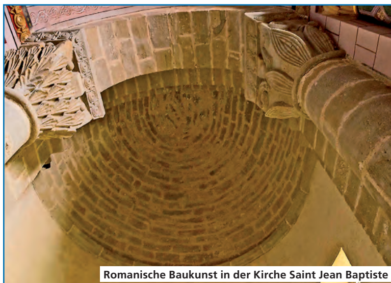
Romanische Baukunst in der Kirche Saint Jean Baptiste