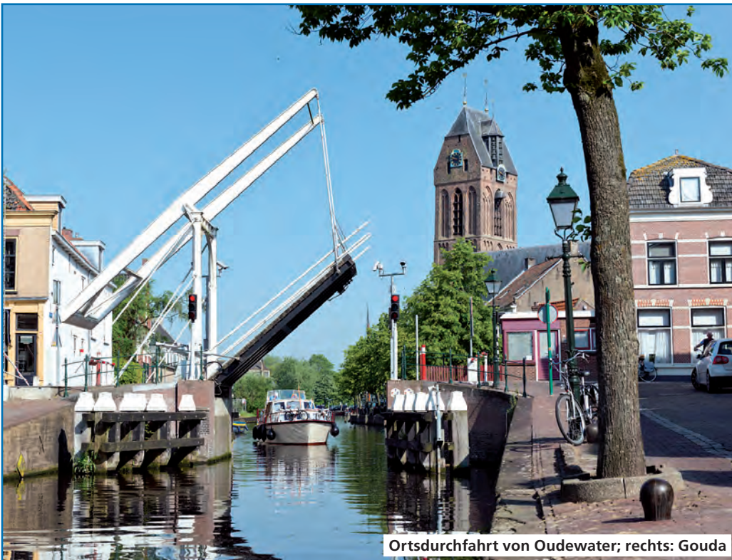
Ortsdurchfahrt von Oudewater; rechts: Gouda