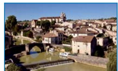
Nérac (Aquitainen / Südwestfrankreich)

Tipp: Italien, Midi/Camargue, Südburgund, Aquitanien.